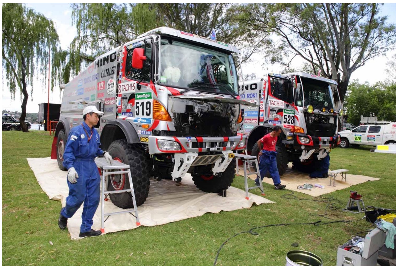
明日の SS に向けて整備される日野レンジャー

3日はアルゼンチンのロザリオ～ヴィラ・カルロス・パス。258 kmのSS（競技区間）が予定されていたが、開催地域は強い雷雨によってコース上のあちこちに水があふれて通行が難しい状況に。加えて近郊のコルドバ空港では厚い雨雲のため一時航空機の離発着が出来なくなり、主催者は午前 10 時に競技の全面中止を決定した。